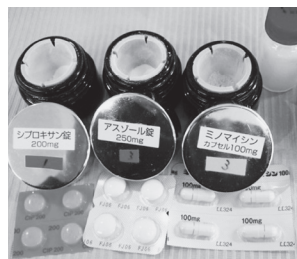
写真2 3種類の抗菌薬

3Mix-MP療法は写真2のように3種類の抗菌薬を混和して応用するもので、手技に熟練を要しますが、比較的多くの歯科医に用いられている効果的な治療法です。ドッグベストセメントは銅の赤茶色が特徴で、その殺菌力を