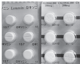
写真1 痛み止め (ロキソニンとカロナール)

歯科医院で出される薬というと、まず思い当たるのは痛み止めになるかと思ひます。顎口腔領域の種々の痛みに対しての対症療法として用いられ、カロナールやロキソニンといったものが多用されています。カロナールは妊婦さんも服用可能な比較