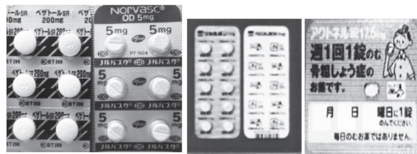
写真4 高脂血症と高血圧、骨粗鬆症の薬

ところで皆さんはお薬手帳をお持ちでしょうか(写真3)。他の医療機関を受診する際に飲み合わせのチェックができますので、歯科を受診の際にも必ずご持参するようにしてください。お薬手帳が見当たらない場合には、お薬情報の紙(図1)やお薬そのもの(写真4)を持参されても結構です。上に述べた薬以外にも、骨粗鬆症の薬(ボナロン、ベネット、リカルボン等)や血液をサラサラにする薬(抗血栓薬-バファリンやバイアスピリン、ワーファリン等)を服用されている方は、歯科治療、特に拔牙をはじめとした外科処置に際して十分な注意が必要となるので、必ず主治医に伝えてください。